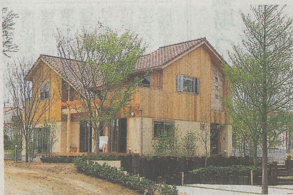
千葉県内で体験宿泊モデルハウスとして使っていた住宅。体験宿泊期間が終わるのを待って、気に入った人が自宅として購入した

足が相当落ち込んでいるためだ。昨年は、所得が向上かず、価格が高止まりしたまま完成後6カ月が完売の目安だったが、現在では、増税後のマンション市況は1層在は1年に延び、販売スピードが落ち込